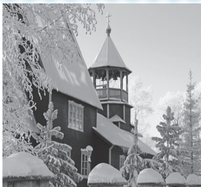
ПОКРОВСКИЙ ХРАМ.